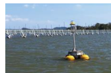
例: 海洋観測ブイによる漁場環境モニタリング技術の開発