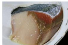
例: 冷凍プリの褐変防止技術の開発