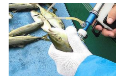
例: ワクチンの開発