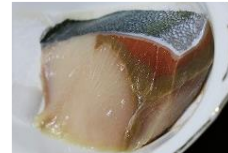
例：冷凍ブリの褐変防止技術の開発