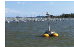
例：海洋観測ブイによる漁場環境モニタリング技術の開発