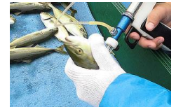
例：ワクチンの開発