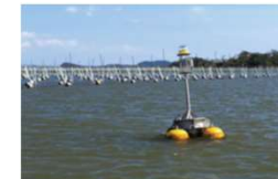
例：海洋観測ブイによる漁場環境モニタリング技術の開発