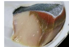
例：冷凍ブリの褐変防止技術の開発