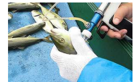
例：ワクチンの開発