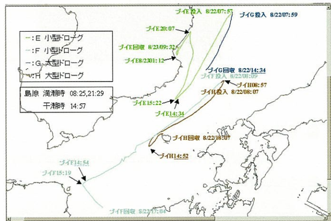
漂流軌跡結果事例